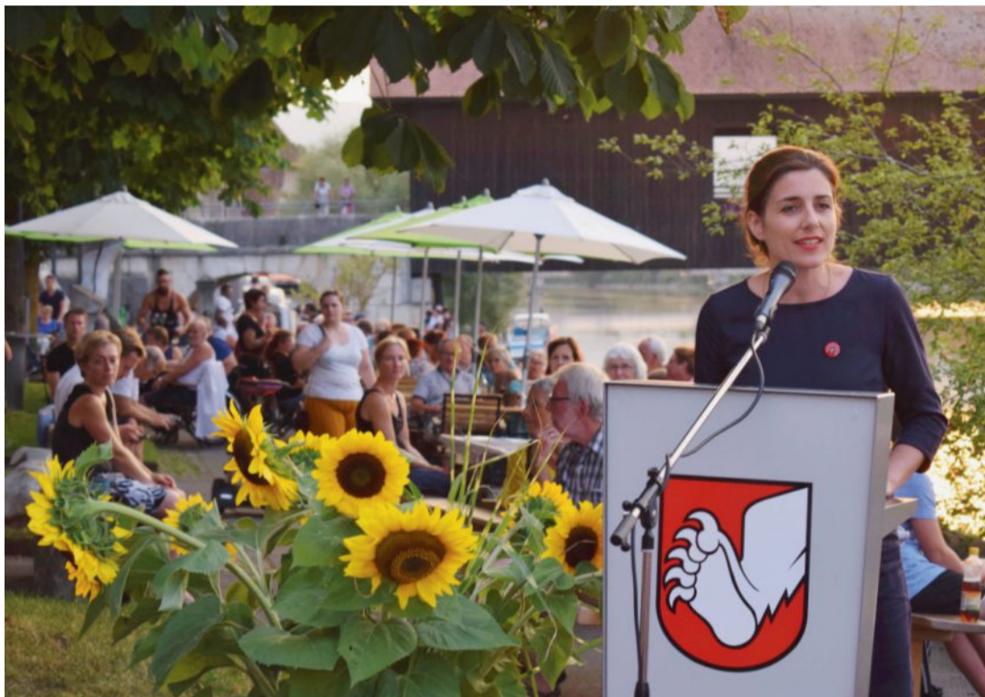
Nationalrätin Flavia Wasserfallen lobte in Büren die Schweizer Konsensdemokratie. Yannik Stähli

Die Festansprache hielt die Berner Nationalrätin Flavia Wasser-